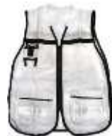
Chaleco Brigadista Blanco