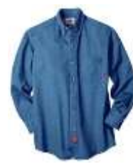
Camisola de Mezclilla