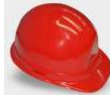
Casco IGA Rojo