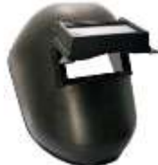
Careta para Soldador