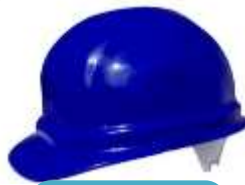
Casco IGA Azul Marino