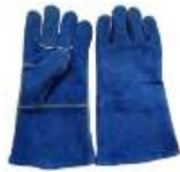
Guante Soldador Azul