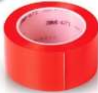
Cinta Delimitadora 2" Roja