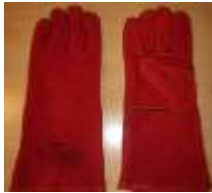
Guante Soldador Rojo