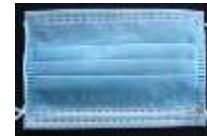
Cubreboca Plisado Azul