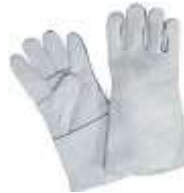
Guante Soldador Azul