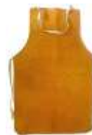
Mandil de Carnaza