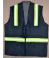
Chaleco de Mezclilla