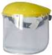
Cabezal Amarillo y mica clara