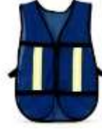
Chaleco Malla Azul