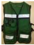
Chaleco Brigadista Verde