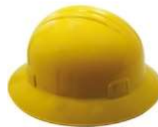
Casco Ala Ancha Amarillo