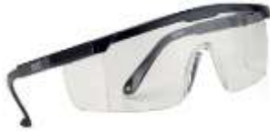
Lente Nitro Claro