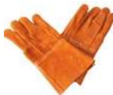
Guante de Carnaza Largo