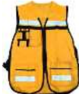
Chaleco Brigadista Amarillo