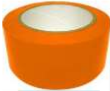
Cinta Delimitadora 2" Naranja