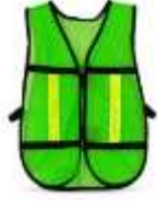
Chaleco Malla Verde