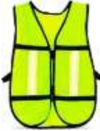
Chaleco Malla Amarillo Lima