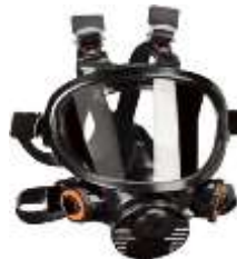
Mascara cara completa 7800 3M