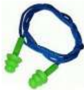
Tapón Auditivo Lavable Libus en bolsita