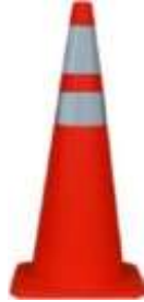
Cono 71 cm con reflejante