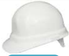
Casco IGA Blanco