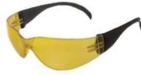
Lente Spy Ámbar