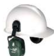
Orejera para montar a casco Blanco