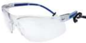
Lente Mercury Claro