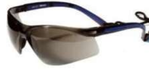
Lente Mercury Gris