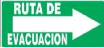
Ruta de Evacuación Derecha