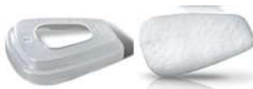
Pre filtro 5N11 y Retenedor 3M