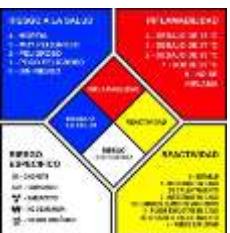
Rombo de Seguridad