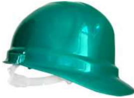
Casco IGA Verde