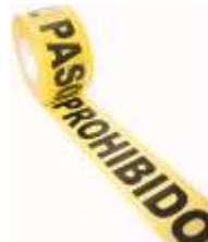
Cinta de Prohibido el Paso