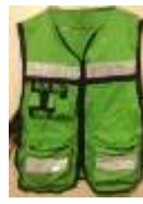
Chaleco Brigadista Verde Limón