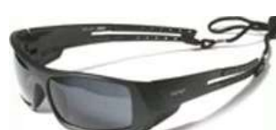
Lente Smart Gris