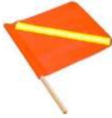
Banderín de Pvc