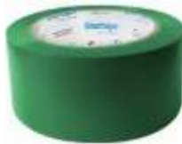
Cinta Delimitadora 2" Verde