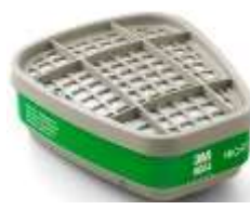
Cartucho 6004 3M