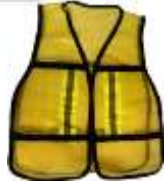
Chaleco Malla Amarillo