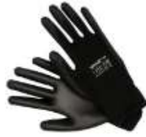
Guante Nylon Poliuretano