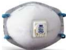
Respirador 8577 3M