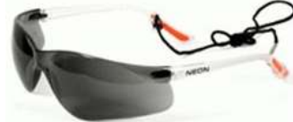
Lente Neon Gris