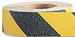
Cinta Antiderrapante 2" Amarillo/Negro