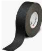
Cinta Antiderrapante 1" Negro