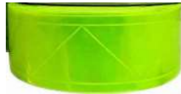
Cinta Prismática Verde Limón