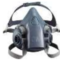
Mascarilla media cara 7502 3M