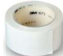
Cinta Delimitadora 2" Blanca