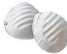
Mascarilla económica Jyrsa