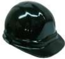
Casco IGA Negro