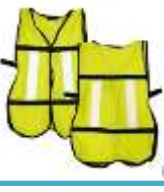
Chaleco de Tela Amarillo