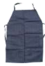
Mandil de Mezclilla