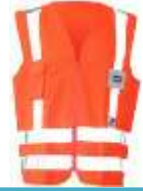
Chaleco Alta Velocidad Rfx Naranja