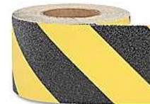
Cinta Antiderrapante 4" Amarillo/Negro