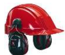
Orejera para montar a Casco Rojo