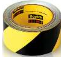
Cinta Delimitadora 2" Amarillo/Negro