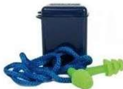
Tapón Auditivo Lavable Libus en Cajita