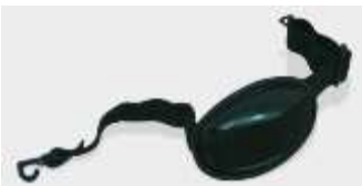
Barbiquejo con Mentón