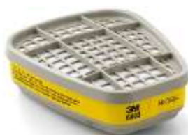
Cartucho 6003 3M