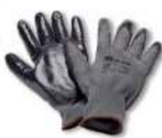
Guante Nylon Nitrilo