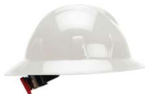
Casco Ala Ancha con Matraca Blanco