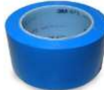
Cinta Delimitadora 2" Azul