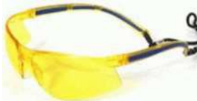
Lente Mercury Ámbar