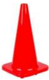
Cono 45 cm