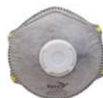
Respirador Dermacare con carbón activado