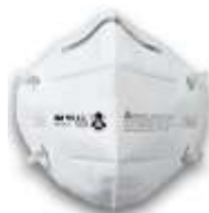
Respirador 9010 3M