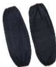
Manga de Mezclilla