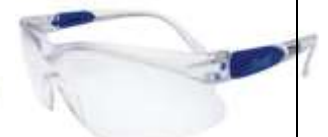
Lente Aero Claro