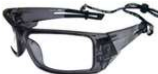
Lente Smart Claro