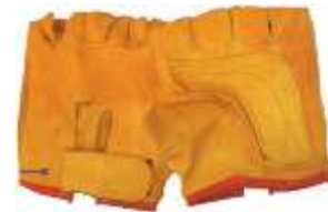
Guantaleta de Piel