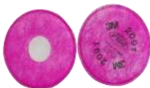
Filtros 2097 3M