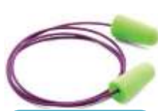
Tapón Desechable Purafit