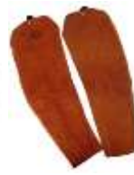
Manga de Carnaza