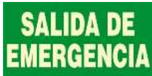
Salida de Emergencia