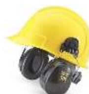
Orejera para montar a Casco Amarillo