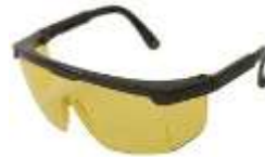
Lente Nitro Ámbar