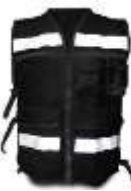
Chaleco Brigadista Negro