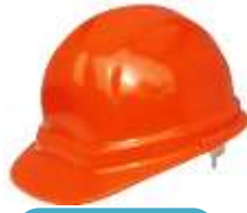
Casco IGA Naranja