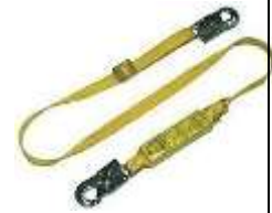
Amortiguador de impacto