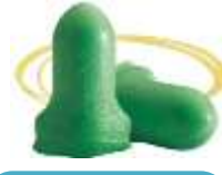
Tapón Desechable Max Lite