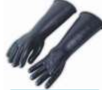
Guante Contra ácidos