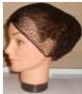
Cofia de Malla Negra