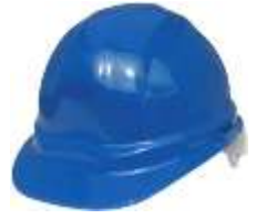
Casco IGA Azul Claro