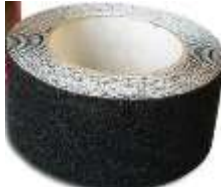
Cinta Antiderrapante 2" Negro