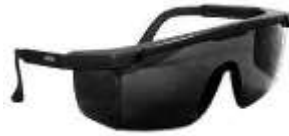
Lente Nitro Gris