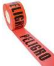
Cinta de Peligro