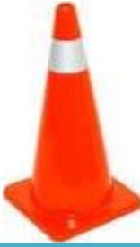
Cono 45 cm con reflejante