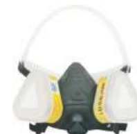
Mascarilla Imax 9000