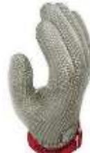
Guante Malla de Acero