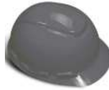
Casco IGA Gris