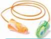
Tapón Desechable Spark Plugs