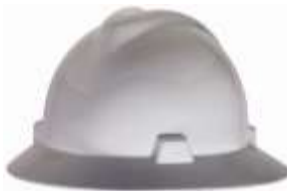
Casco Ala Ancha Blanco