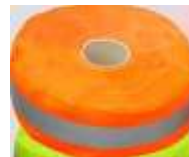
Cinta Reflejante Naranja/Gris