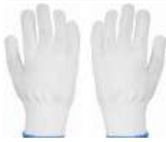
Guante Nylon Blanco