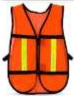
Chaleco Malla Naranja