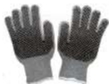
Guante Japonés con puntos de PVC