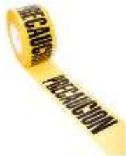
Cinta de Precaución