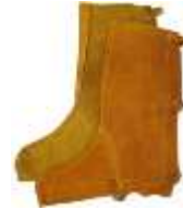
Polainas de Carnaza