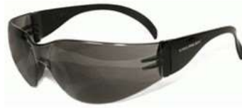
Lente Spy Gris