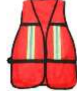
Chaleco Malla Rojo