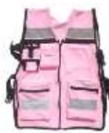
Chaleco Brigadista Rosa