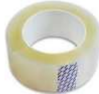
Cinta Transparente 2"