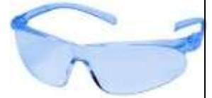
Lente Spy Azul