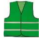
Chaleco de Tela Verde