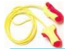
Tapón Desechable Laser Lite