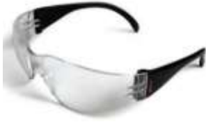
Lente Spy Claro