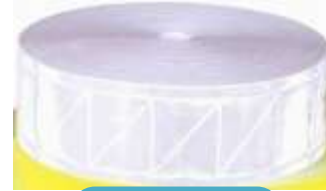
Cinta Prismática Plata