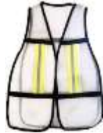
Chaleco Malla Blanco