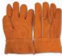
Guante de Carnaza Corto