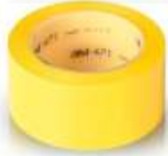
Cinta Delimitadora 2" Amarilla