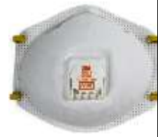
Respirador 8511 3M