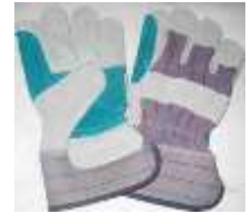
Guante Chino Doble Palma