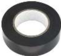
Cinta de Aislar