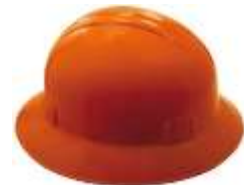
Casco Ala Ancha Naranja