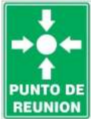
Punto de Reunión