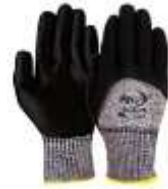
Guante Anti corte