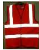
Chaleco de Tela Rojo