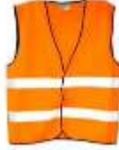
Chaleco de Tela Naranja