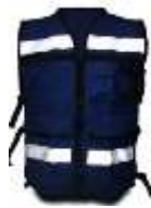
Chaleco Brigadista Azul Marino