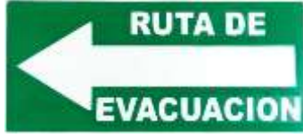
Ruta de Evacuación Izquierda