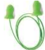
Tapón Desechable Meteoro