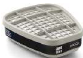
Cartucho 6001 3M