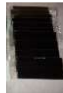
Cristal Sombras para Careta