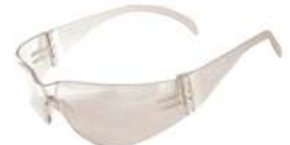
Lente Spy in/out