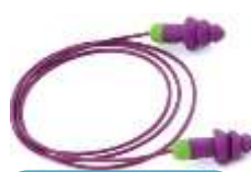
Tapón Desechable Rockets