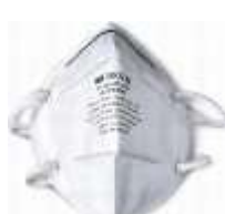
Respirador 9002 3M