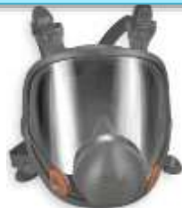
Mascara cara completa 6800 3M