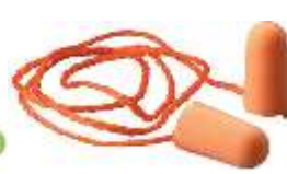
Tapón Auditivo Desechable 3M