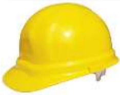
Casco IGA Amarillo