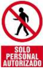
Solo Personal Autorizado