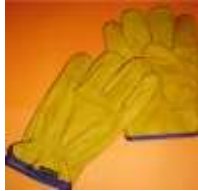
Guante Argonero de Cerdo