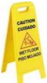
Tijera Piso Mojado