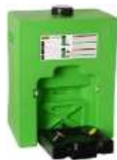
Ducha Lavaojos Portátil