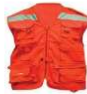
Chaleco Brigadista Max Track