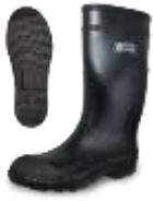
Bota Jardinera Negra