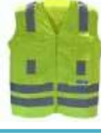
Chaleco Alta Velocidad Rfx Verde