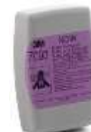
Cartucho 7093 3M