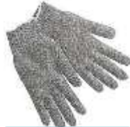
Guante Japonés Gris