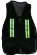
Chaleco Malla Negro