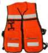
Chaleco Brigadista Naranja