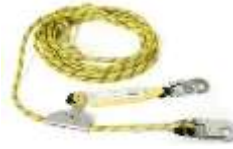
Línea de Vida