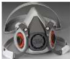
Mascarilla media cara 6002 3M