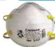
Respirador 8210 3M