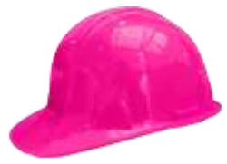
Casco IGA Rosa