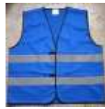
Chaleco de Tela Azul