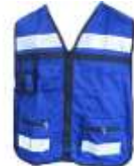
Chaleco Brigadista Azul