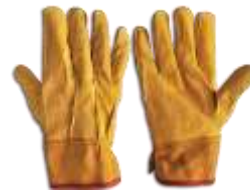
Guante Operador de cerdo